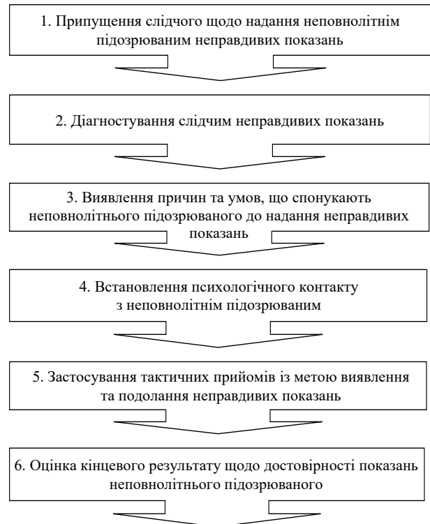
Рис. 2. Механізм виявлення та подолання неповнолітнім підозрюваним неправдивих показань

цію щодо вчиненого кримінального правопорушення.